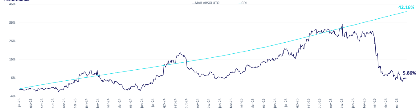
Atribuição de Performance - Desde o Início e 12 meses**